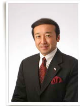
辻堂東海岸三丁目町内会会長